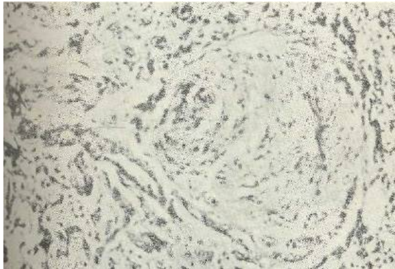
Fig. 4 En este corte se evidencia la invasión perineural, característica del adenocarcinoma pancreático. 45 X