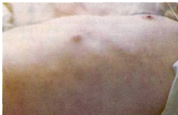
Fig. No. 1. Nódulos subcutáneos de necrosis grasa.

Múltiples nódulos dolorosos de 2-3 Cm. de diámetro, bilaterales en ambas piernas, artritis en dedo medio derecho, sensibilidad ++, inflamación ++, limitación +, rodilla izquierda dolorosa inflamada S++, inflamacion ++, L +, tobillos S++, I+, L+, Se diagnosticó Eritema nodoso tres días después de su ingreso desarrolló múltiples nódulos de sensibilidad variable (Fig. No. 1) indoloro ligeramente doloroso, moderadamente dolorosos y bien sensibles. Artritis aumentó en varias falanges, ambas rodillas, con efusión y dolor plantar agudo con enrojecimiento y calor local a lo largo de ambas fascias plantares. Se abandonó diagnóstico de eritema por cáncer de páncreas, nódulos de necrosis grasa y poliartritis.