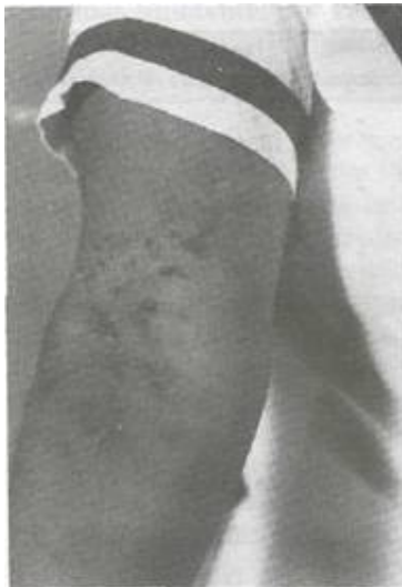
Fig. 1. Nocardiosis Linfocutánea. Lesión con múltiples vesículas que fluctúan segregando material seropurulento y adenomegalias en cadena en dirección proximal.

Al examen físico tiene una frecuencia cardíaca y pulso de: 88/min. , frecuencia respiratoria de 18/min. , presión arterial de: 130/76 mmHg. y temperatura de 37.2 oC. Es una paciente en la cuarta década de la vida, lúcida y cooperadora, que no luce apariencia de enfermedad sistémica. Se aprecia a nivel del pliegue cubital anterior derecho, una lesión caracterizada por: a) nodulaciones en cadena, levemente dolorosas y que presentan leve rubor, b) múltiples cicatrices puntiformes diseminadas homogéneamente en piel suprayacente, con dos pequeñas costras serohemáticas en lesiones de reciente erupción c) leve aumento relativo del diámetro braquial. El resto del examen físico fue normal. (fig. 1).