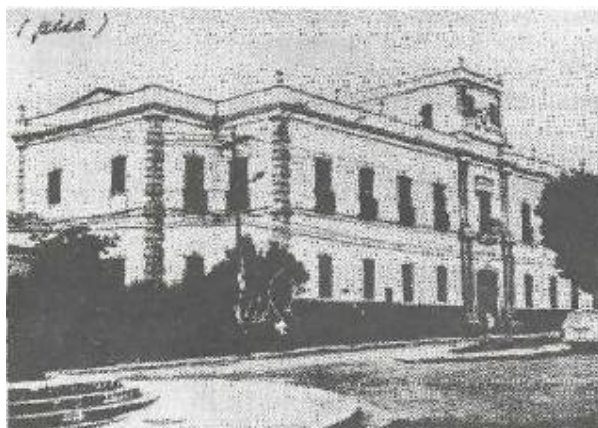
Hospital General San Felipe. 1969