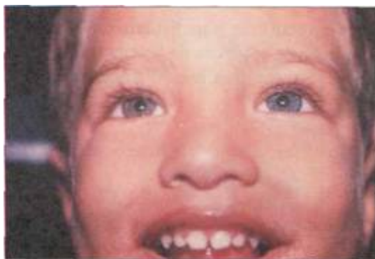
Segundo caso de Heterocromía iridiana observado en Honduras.