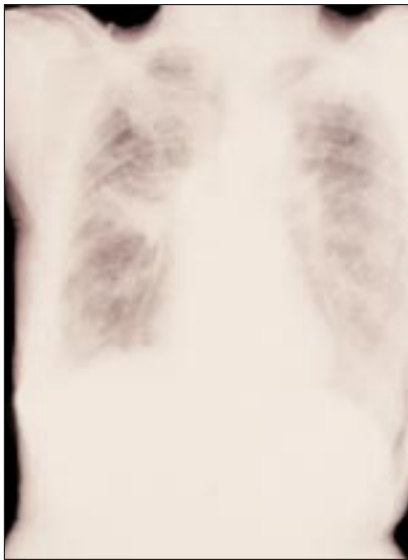
Figura No. 1