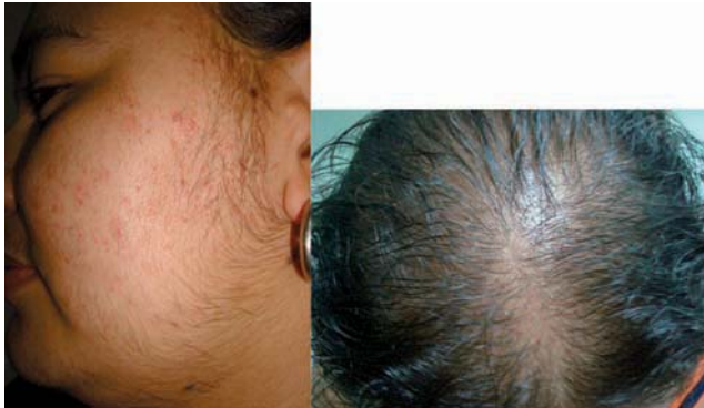
Figura 2. Manifestaciones dermatológicas de hiperandrogenemia. A Femenino de 28 años con acné e hirsutismo. B Alopecia con patrón androgénico.