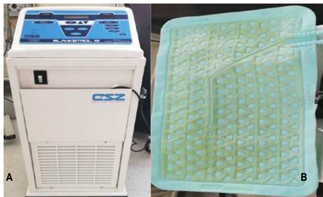
Figura 1. Máquina de hipotermia Blanketrol III, Modelo 233 (A) y accesorio manta de enfriamiento corporal total (B), Sala de Recién Nacidos, Departamento de Pediatría, Hospital Escuela, Tegucigalpa.

Se realizó un estudio cuasi experimental con evaluación sobre conocimientos y actitudes acerca del tema EHI e HT antes y después de una intervención educativa en el Hospital Escuela, Tegucigalpa, durante mayo 2019. Se incluyó en el estudio a personal médico especialista en pediatría y subespecialistas en neonatología y cuidados intensivos que laboran en emergencia y sala de recién nacidos, personal profesional de enfermería y auxiliares de enfermería de Unidad de Cuidados