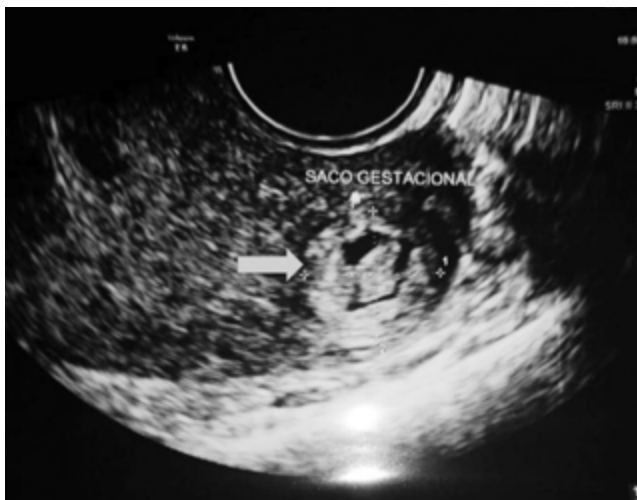
Figura 1. Saco gestacional irregular con botón embrionario sin latido cardíaco ubicado en miometrio posterior izquierdo (flecha azul).

de amenorrea de 7 semanas, se realizó prueba de embarazo con resultado positivo. Al examen físico, paciente se encontraba dentro de parámetros normales. Se realizó ultrasonido pélvico donde se observó endometrio lineal sin evidencia de saco gestacional. Se deja como impresión diagnóstica embarazo temprano y se cita en 2 semanas. Paciente retorna a las 2 semanas con historia de sangrado transvaginal leve de 2 días de evolución sin otro síntoma acompañante, se realizó especuloscopia donde se observa cérvix cerrado con escasos restos hemáticos, se realizó de nuevo ultrasonido pélvico donde se observó endometrio lineal sin ecos mixtos en su interior y sin presencia de saco gestacional en endometrio y anexos. No se observaron masas (miomas) ni líquido libre. Se dejó como impresión diagnóstica embarazo temprano versus aborto completo; se enviaron niveles de hormona gonadotropina coriónica humana fracción beta que reportó 600 UI/ml. dos días después se repite la prueba y reporta 5000 UI/l. Paciente inicia con dolor pélvico de moderada intensidad tipo cólico, acompañado de sangrado transvaginal. Se realizó un tercer ultrasonido pélvico (Figura 1)