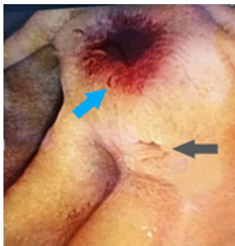
Figura 2. Duodenoscopia en la cercanía de la lesión a la papila duodenal. Se observa angiodisplasia (flecha azul) y la papila duodenal (flecha gris).