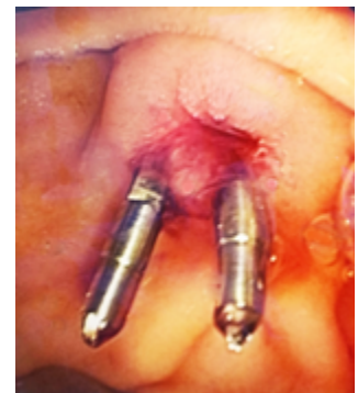
Figura 4. Colocación de hemoclips. Se coloca a 1-2 cms de la papila duodenal, se observa flujo biliar.