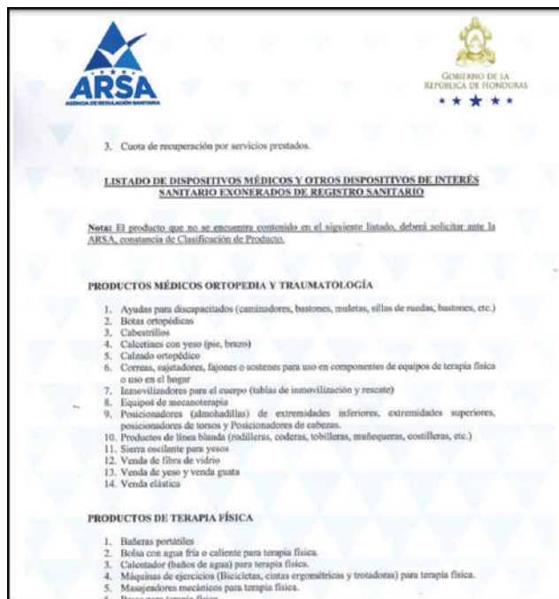
Figura 3. Informe de exoneración de registro sanitario. C-0008-ARSA-2020. 12

posicionamiento, aros y molduras de lentes, lentes graduados y no graduados, sistemas auditivos complementarios, entre otros que deberían ser exonerados, pero en la práctica no ocurre lo que dificulta que las personas tengan acceso a estos productos. 23 (Figura 3).