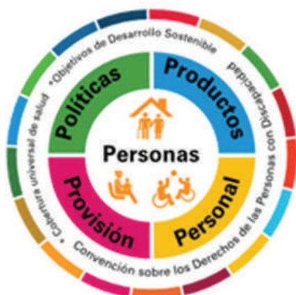
Figura 2. Las cinco áreas de la Tecnología de Apoyo. 10

dad, el desempeño y la durabilidad, y ayudar a simplificar los procesos de adquisición. El personal dedicado a la tecnología de apoyo incluyendo al de atención de primaria y comunitaria debe recibir capacitación y educación continua, así como los profesionales relacionados y las redes de apoyo (Figura 2). 12,19 Este es un enfoque integral que permite analizar no solo la disponibilidad y accesibilidad de la tecnología de apoyo sino también el impacto de las políticas públicas, los costos asociados y la percepción de las personas con discapacidad respecto a su utilidad y adecuación. 20