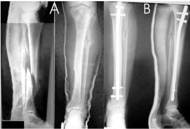
Figura 1. Radiografía pre y postquirúrgica de fractura de tibia. (A) Fractura oblicua larga de diáfisis media de tibia. (B) Radiografía control con clavo intramedular de tibia.