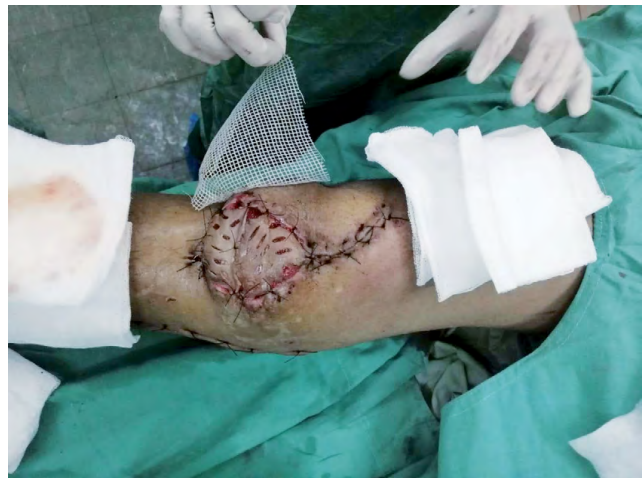
Figura 1. Reconstrucción total con colgajo Gastrocnemio en paciente atendido con Fractura proximal de tibia en HE.

* Clasificación de fracturas según Gustilo y Anderson 13