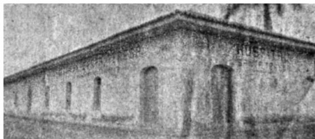
Figura 1. Hospital Santa Teresa, década de 1930. Revista Anales del Hospital Santa Teresa, volumen 1, número 1, página 1.

En este artículo se describe la historia de la fundación legal, la construcción y los primeros años de operación del hospital Santa Teresa de Comayagua, con el objetivo de dar a conocer las dificultades y vicisitudes del establecimiento de un hospital en la Honduras de la década de 1930 ver Figura 1 . El Hospital Santa Teresa de Comayagua fue creado para suplir la carencia de un centro de salud en la zona central del país. 1 Desde el decreto de su fundación en 1931, tuvieron que pasar cinco años para que el establecimiento comenzara a funcionar. En este artículo histórico se presenta un recorrido desde la creación del hospital, pasando por el trabajo de la junta directiva para ponerlo en marcha hasta su inauguración en 1936, y las cifras de sus primeros años. El Hospital comenzó a funcionar en el gobierno de Tiburcio Carías Andino (1933-1949), por lo que se ha utilizado este periodo presidencial para fijar los límites históricos. La información de este artículo proviene de los informes que la junta directiva y el director del Hospital dirigían