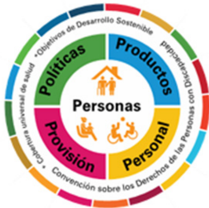
Figura 2. Las cinco áreas de la Tecnología de Apoyo. 10

dad, el desempeño y la durabilidad, y ayudar a simplificar los procesos de adquisición. El personal dedicado a la tecnología de apoyo incluyendo al de atención de primaria y comunitaria debe recibir capacitación y educación continua, así como los profesionales relacionados y las redes de apoyo. (Figura 2). 12,19 Este es un enfoque integral que permite analizar no solo la disponibilidad y accesibilidad de la tecnología de apoyo sino también el impacto de las políticas públicas, los costos asociados y la percepción de las personas con discapacidad respecto a su utilidad y adecuación. 20