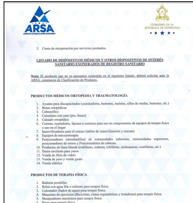
Figura 3. Informe de exoneración de registro sanitario. C-0008-ARSA-2020. 12

posicionamiento, aros y molduras de lentes, lentes graduados y no graduados, sistemas auditivos complementarios, entre otros que deberían ser exonerados, pero en la práctica no ocurre lo que dificulta que las personas tengan acceso a estos productos. 23 (Figura 3).